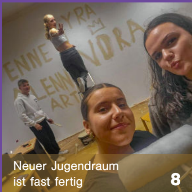
Neuer Jugendraum ist fast fertig