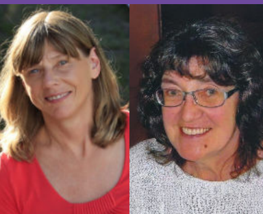
Wechsel im Zachäus- Gemeindebüro