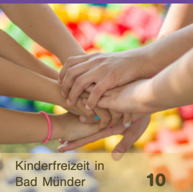
Kinderfreizeit in Bad Münders