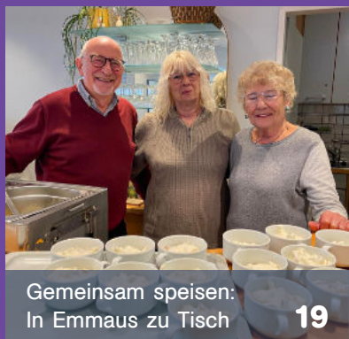
Gemeinsam speisen: In Emmaus zu Tisch