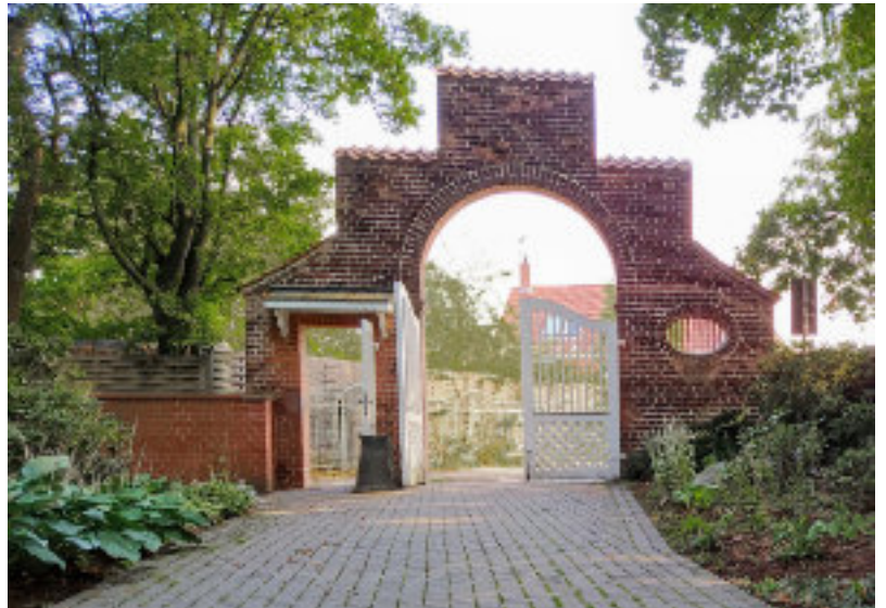
Eingangsbereich des Herrenhäuser Friedhofs

Der Friedhof soll ein Ort der Ruhe für die Toten und zugleich ein Ort der Hoffnung für die Lebenden und Trauernden sein. Helfen Sie mit, damit dies auch in Zukunft gelingt.