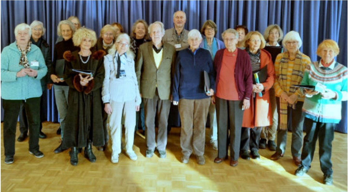
Die CAPELLA VOCALE HERRENHAUSEN ist ein Chor von derzeit rund 25 Sängerinnen und Sängern