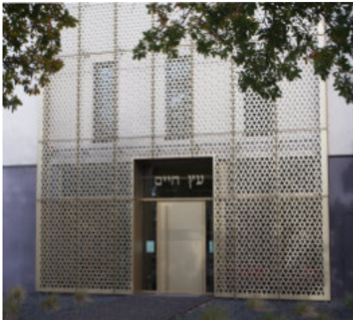
Eingang des Kultur- und Gemeindezentrum Etz Chaim

Tel. 01522-95 24 093, Mail: olaf.koeritz@evlka.de