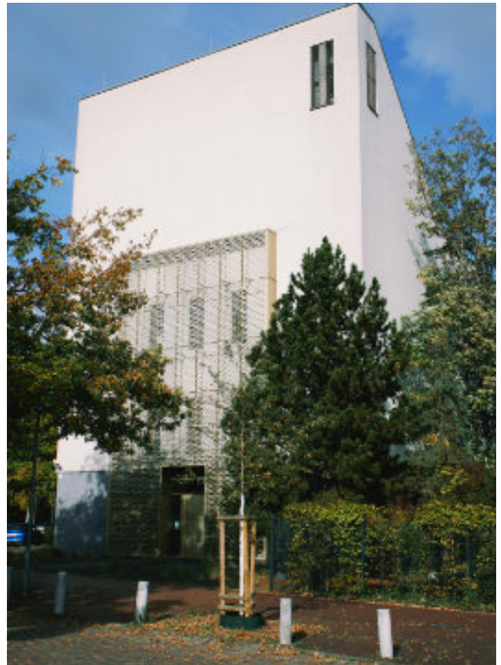
2009 wurde das Kultur- und Gemeindezentrum Etz Chaim in der entwidmeten Gustav-Adolf-Kirche eröffnet