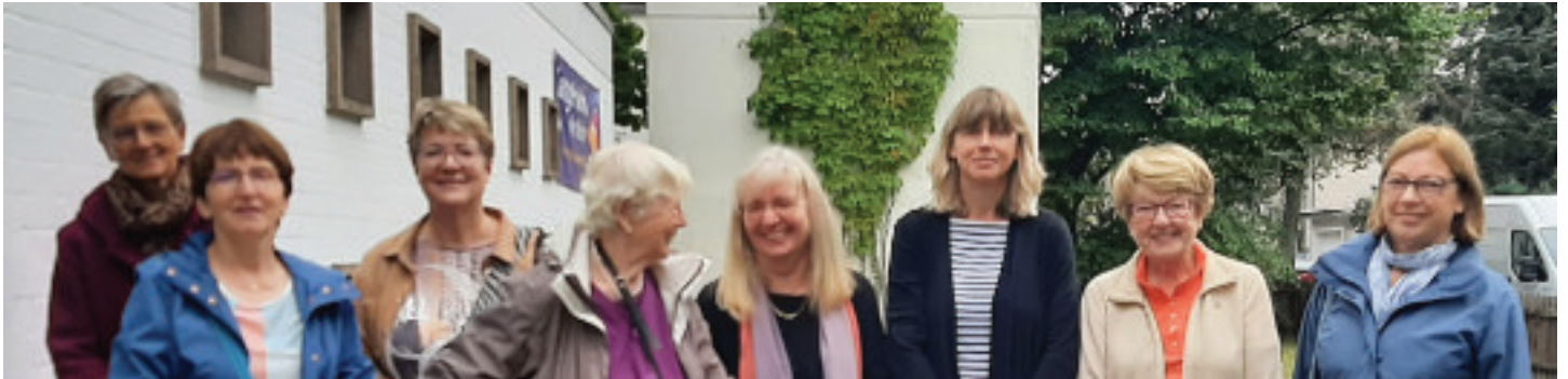
Der Zachäus-Kirchenchor sucht noch weitere Mitsängerinnen