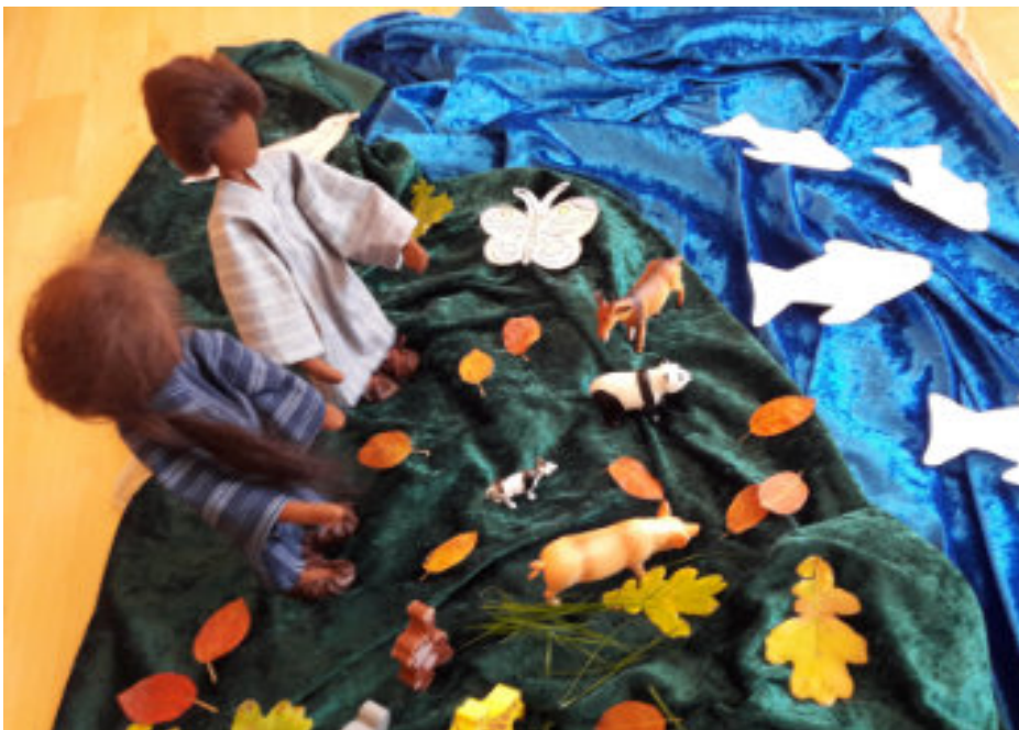
Bodenbild zur Schöpfungsgeschichte